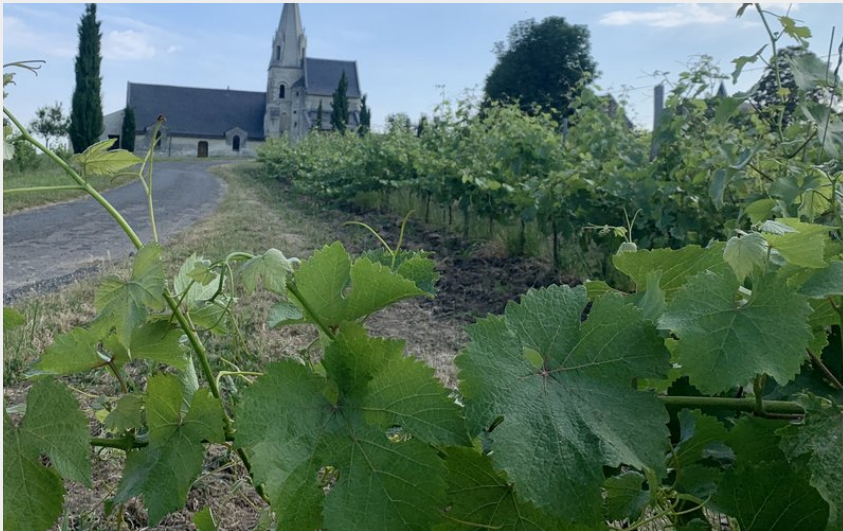
Eglise et Vignoble (Aude Genevaise - SPL SVLT)