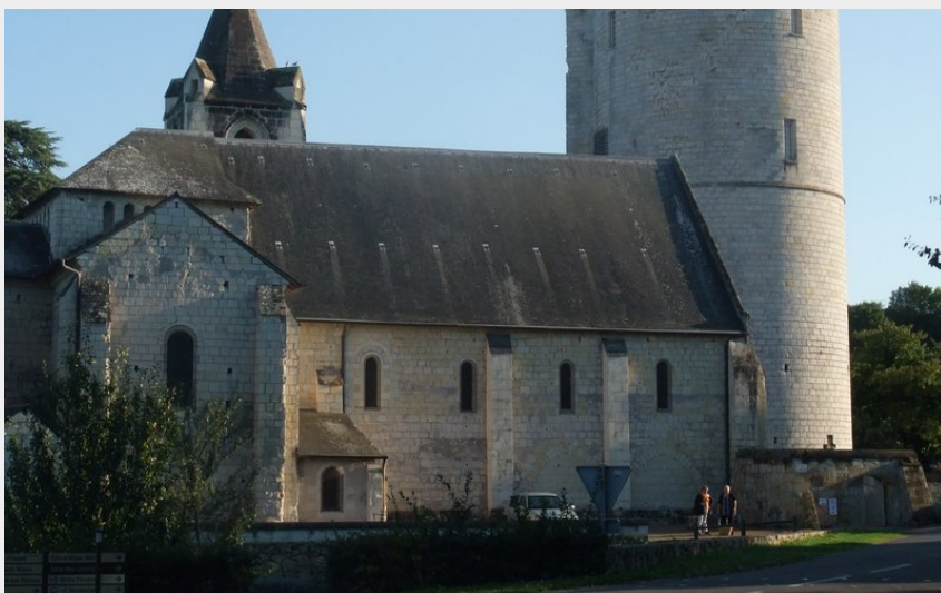
L'église Saint-Aubin et la Tour de Trèves

Balades et randos région de Saumur - Gennes-Val-de-Loire