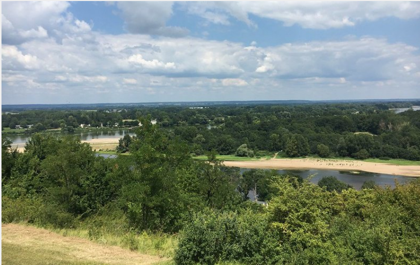
Vue sur la confluence de la Vienne et de la Loire (Aurore Poveda)