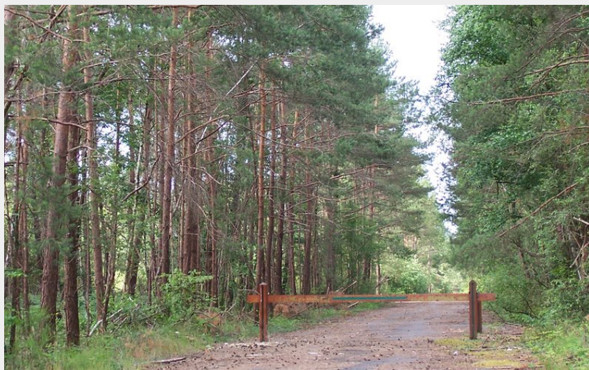
(CCCVL- Fabienne Bouéroux)