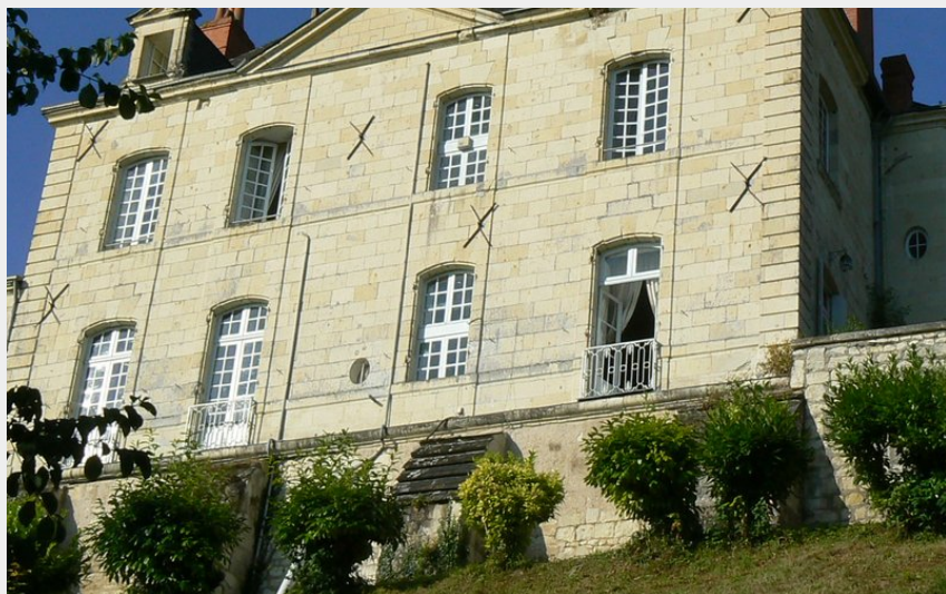
(CCCVL- Fabienne Bouéroux)