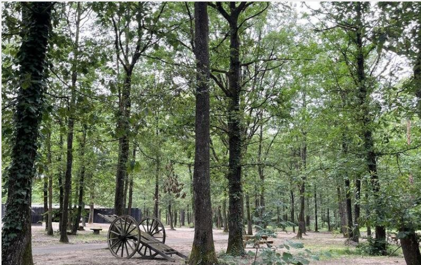
(Elise Léonard - Communauté d'Agglomération Saumur Val de Loire)