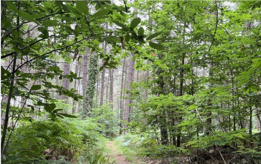
(Elise Léonard - Communauté d'Agglomération Saumur Val de Loire)