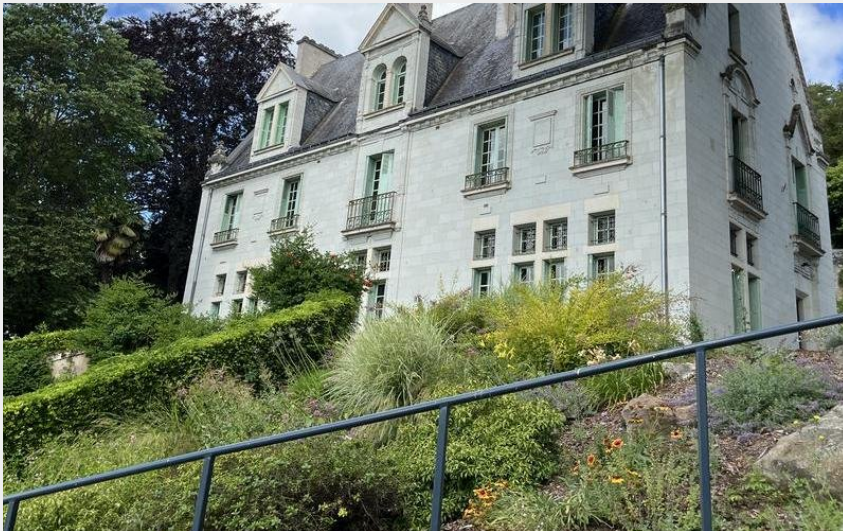
Gennes Val de Loire (Elise Léonard - Communauté d'Agglomération Saumur Val de Loire)