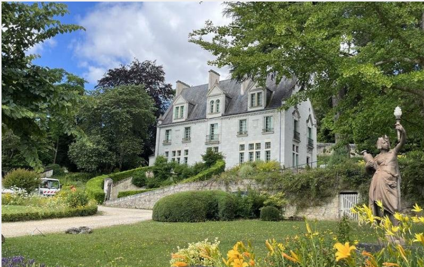
Gennes Val de Loire