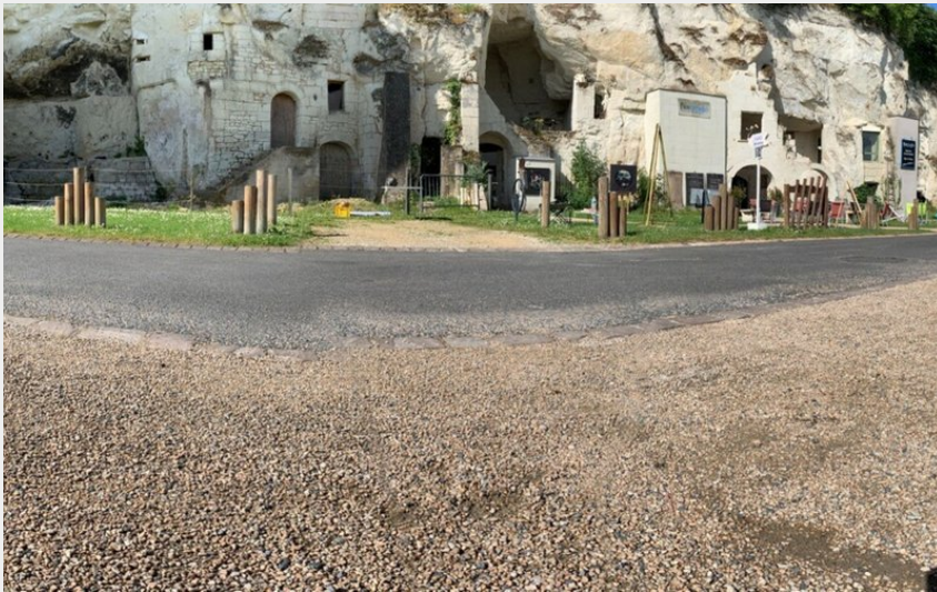
Turquant (Aude Genevoise)