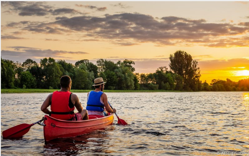
La Vienne, un cours d'eau surprenant