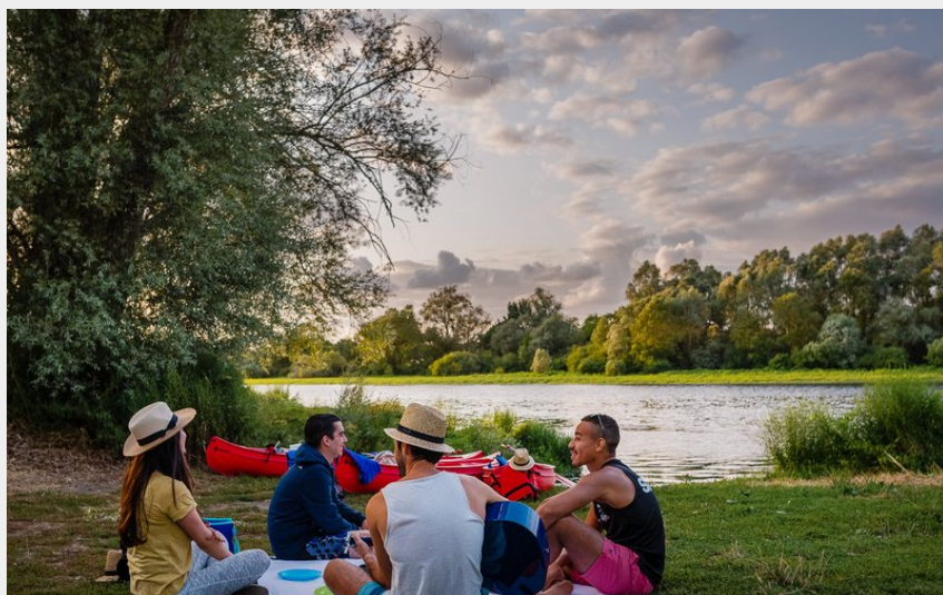
Pause au bord de la Vienne