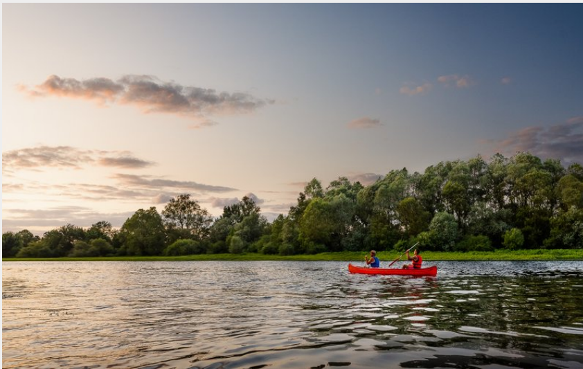
Coucher de soleil sur la Vienne