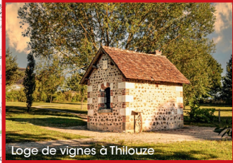
Loge de vignes à Thilouze