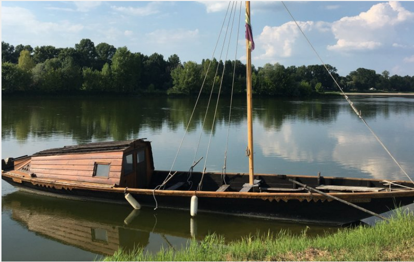
Photographie d'une toute sur la Loire (Aurore Poveda)