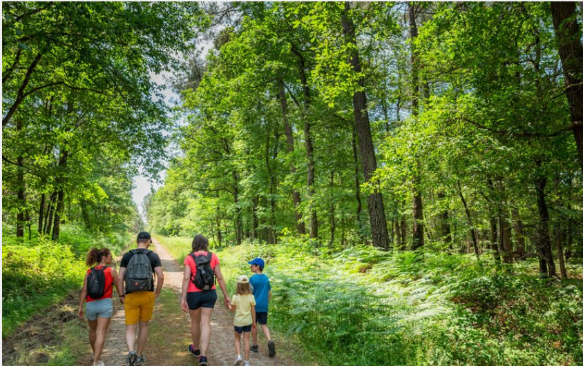
Photographie de personnes se promenant dans la forêt de Chinon (Jean-Christophe Coutand)