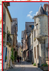
Chinon : entre ville médiévale et forêt domaniale