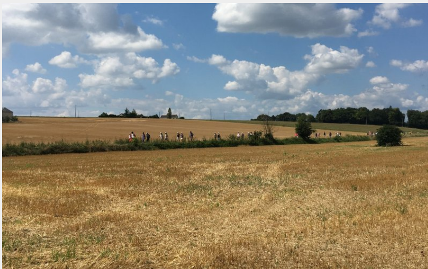
Photographie d'un champ de blé sous le soleil (Aurore Poveda)