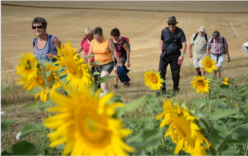
Photographie d'un champ de tournesol, avec randonneurs en fond (Aurore Poveda)