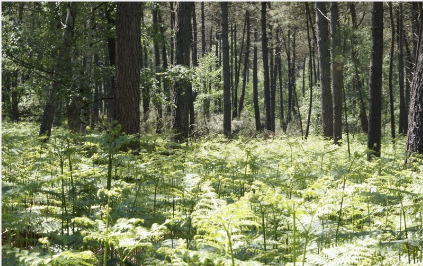
La forêt