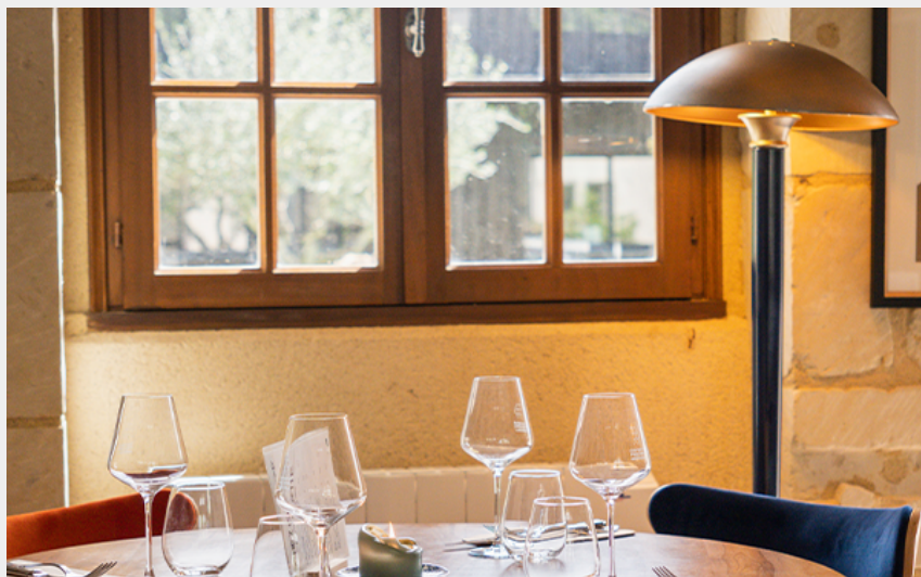
Crédit : Chez Odette - Restaurant à Saint-Nicolas-de-Bourgueil (Anisha Patelita)