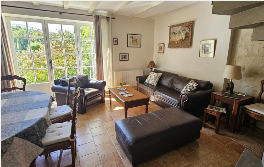
Crédit : Beaurepaire - La Perrée_4 (© Relais des gîtes de Touraine)