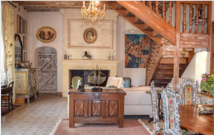
Closerie de La Véronique_3