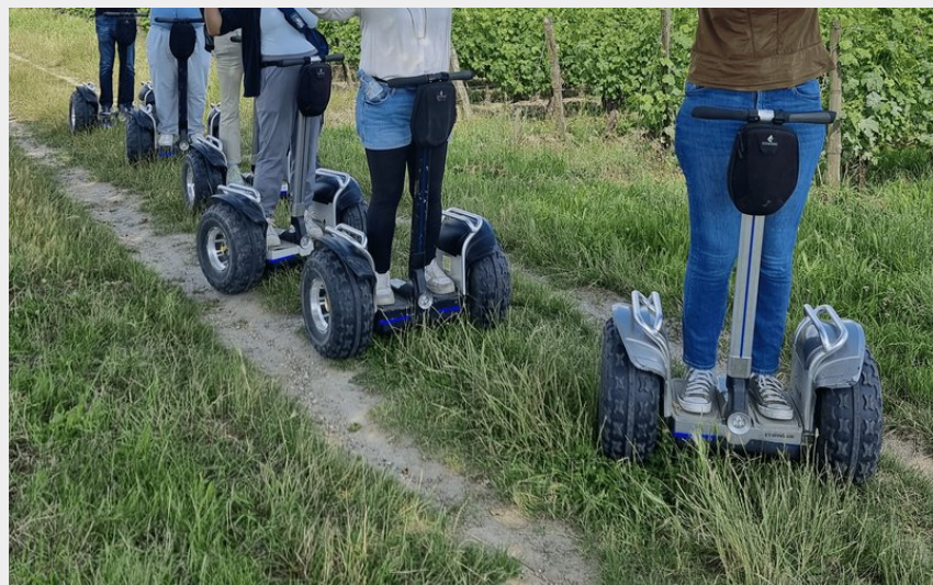
Crédit : Balade-gyropodes-électriques-vignes (Sébastien TROVA - Ligaya)