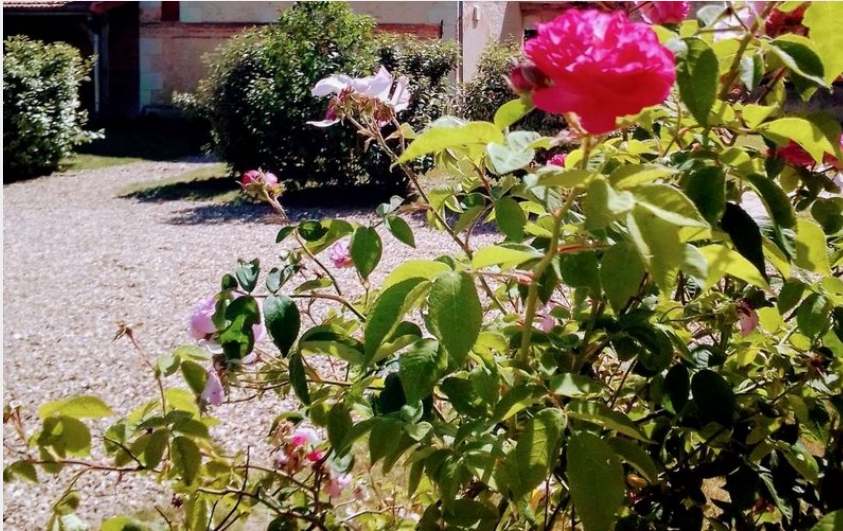
Crédit : BRAYE SOUS FAYE-Au repos des elfes- MURIS Régis (11) (Regis MURIEL)