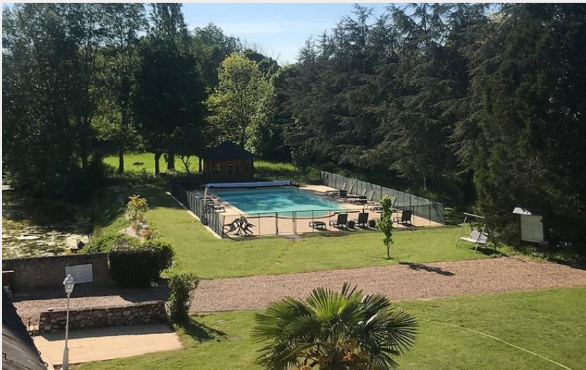
Le Château de Hommes_2