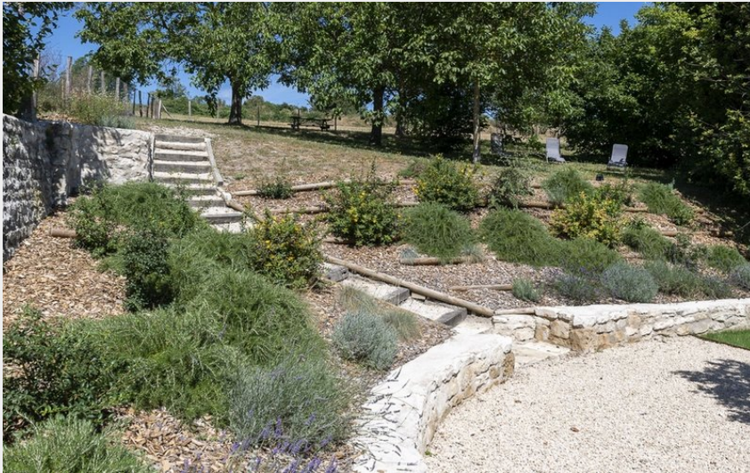
Crédit photo : Le-Petit-Munet-Lemere-La grange 088-1 (Brigitte Wawrant)