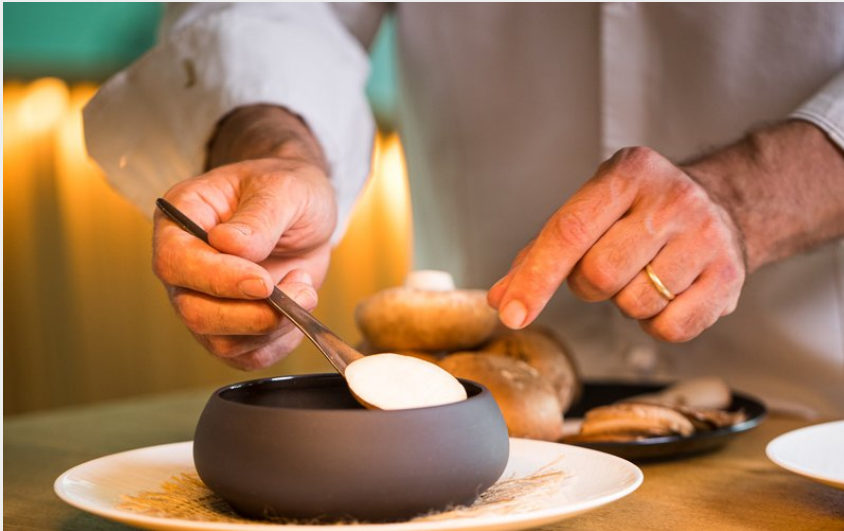
Fontevraud L'Ermitage, restaurant