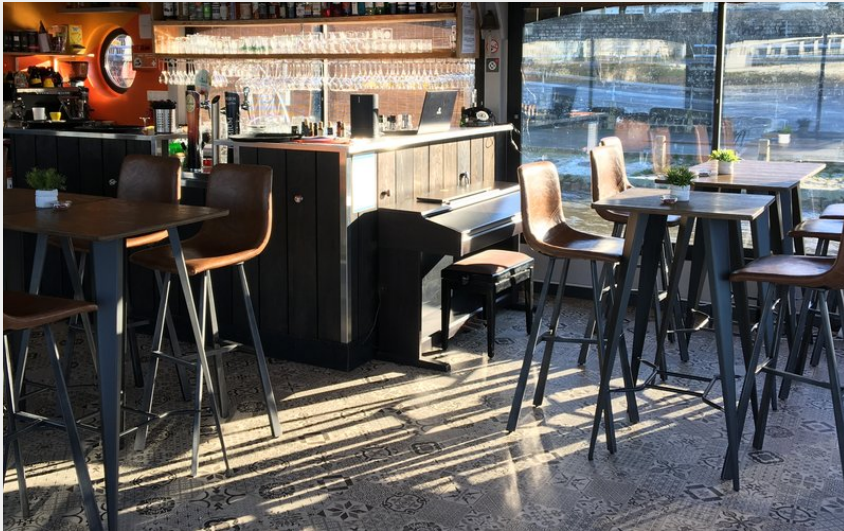
Crédit photo : Une confortable salle intérieure entièrement vitrée (Roels)