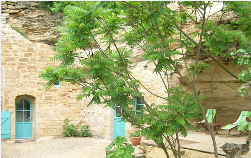
Crédit : Gîte la Troglo 3 étoiles séjour insolite près de Saumur (Antoine et Sandrine Paris - Gîte la Troglo)