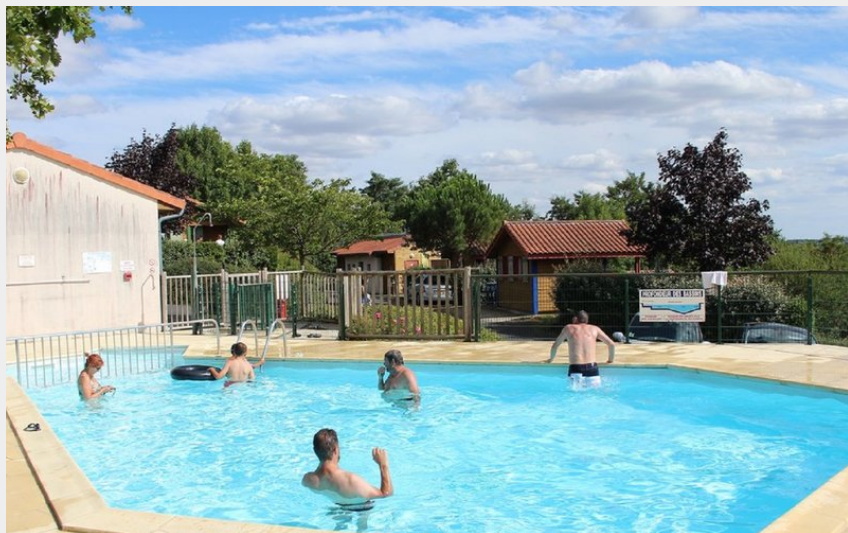
Crédit photo : piscine camping Les Grésillons (Jérôme Alopé Camping Les Grésillons)