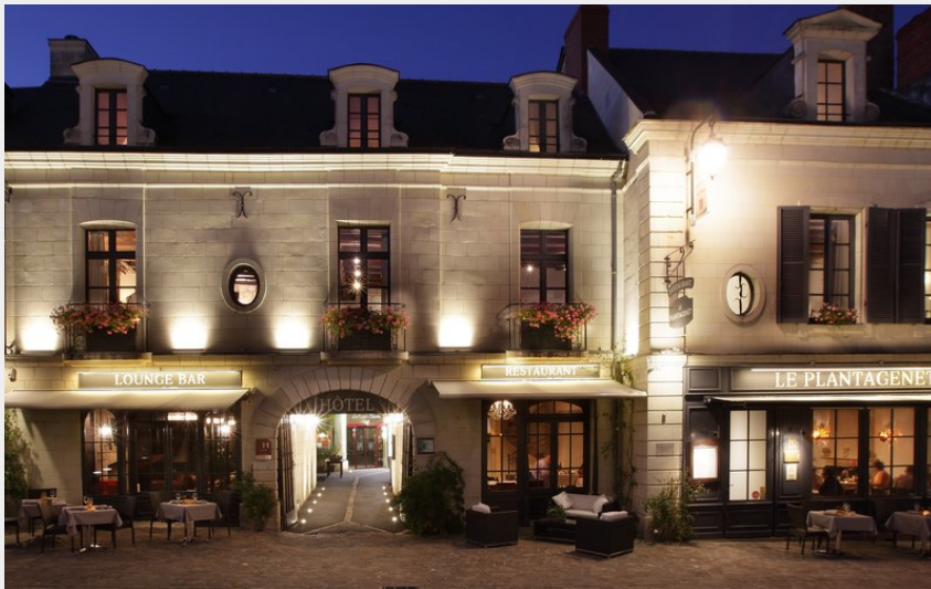
Crédit photo : Façade de l'hôtel-restaurant de nuit (Hotel La Croix Blanche Fontevraud)