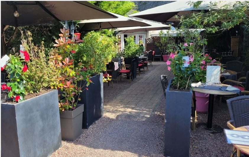
Crédit : Les Grottes - Restaurant à Azay-le-Rideau (Julie Breillat)