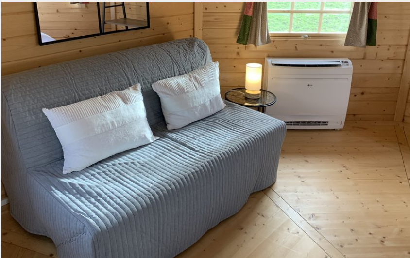
Crédit photo : La Tour Saint-Gelin - La Ménardière (Philippe Lamboul)