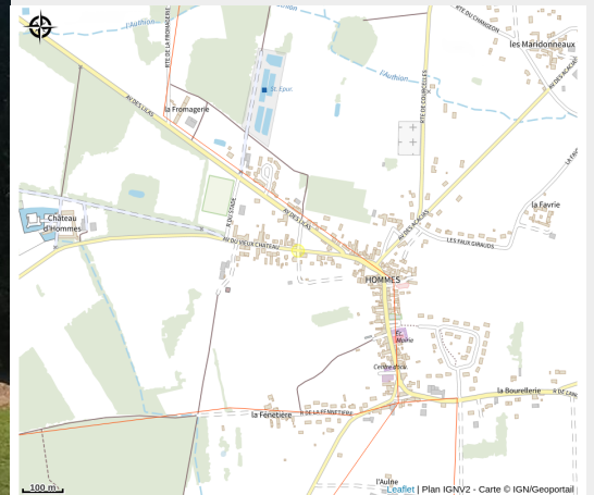
Le Château de Hommes_2

Au coeur des châteaux de la Loire et des vignobles. Dans le cadre exceptionnel d'un château du XVème siècle. Chambres d'hôtes, avec le confort d'aujourd'hui dont l'une se situe dans une romantique petite tour. Randonnée pédestre sur le domaine de 170 ha. Piscine chauffée, jacuzzi, spa. Wifi Gratuit. Contacts : Hubert et Albine Hardy