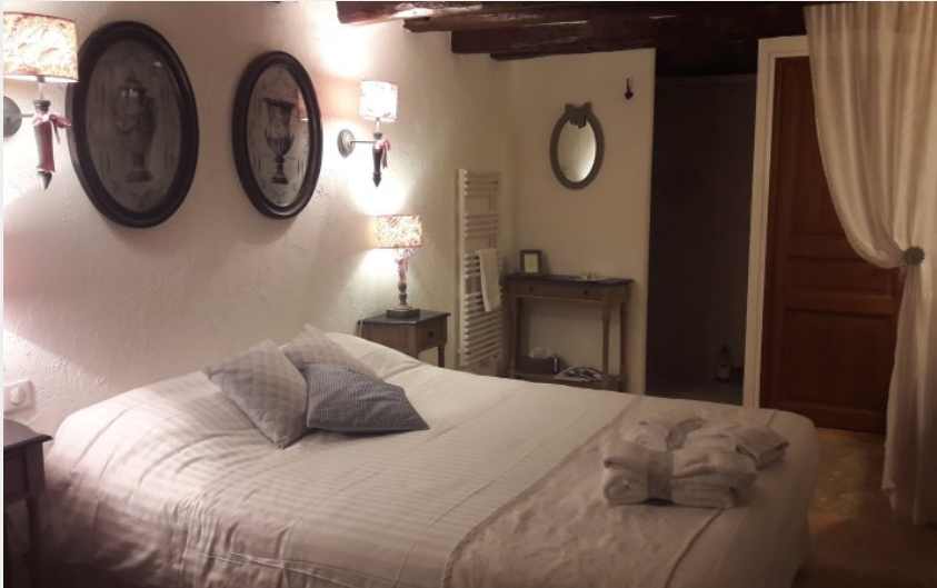
Crédit : SAVIGNY EN VERON- Chambre d'hôtes - La magnanerie-Cocon refait 2 (PIERRETTE André)