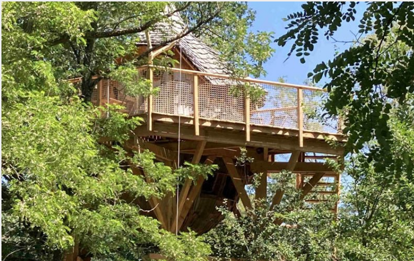
Crédit : Trova - La batelière sur Loire (Trova - La batelière sur Loire)