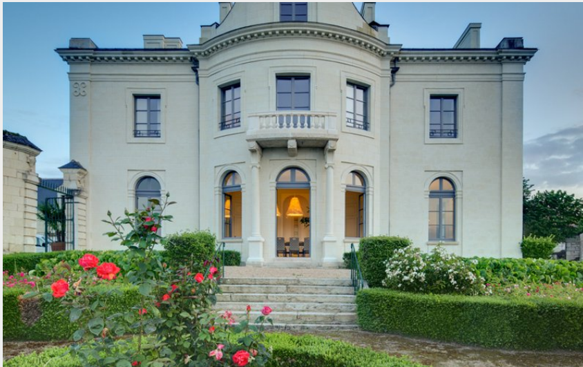
Crédit : ACVL-CANDES-SAINT-MARTIN--Loft-du-Chateau-7- (Hadrien BRUNNER)