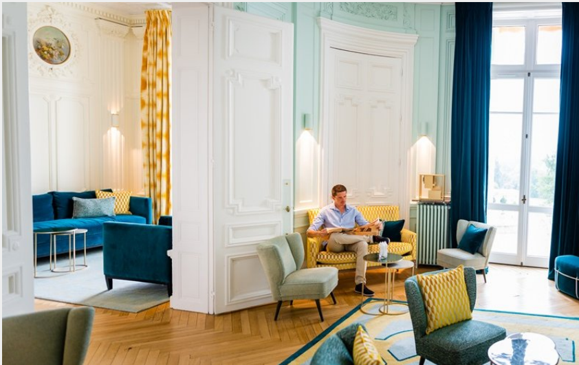
Domaine de la Tortinière - Veigné