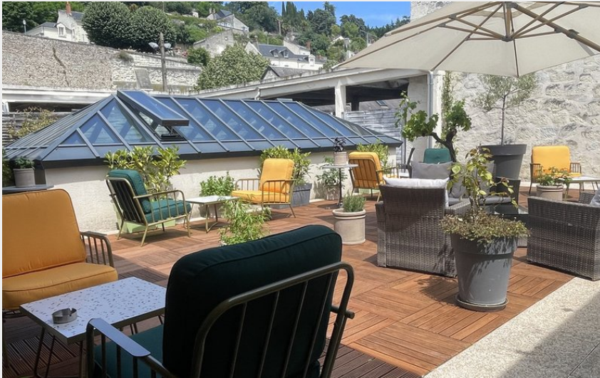
Crédit photo : CHINON-Best western - Salle PDJ 6Patio 3 (Romain BERANGER)