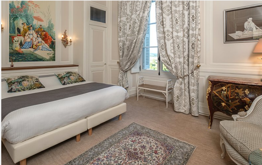
Crédit photo : chambre-hotel-de-luxe-touraine (2) - Copie (Erwan Fiquet)