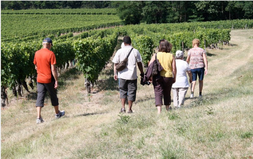
Crédit photo : Domaine du Saut au Loup, à Ligré - AOC chinon (Eric Santier)