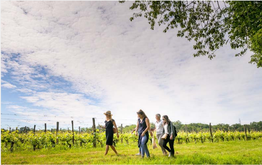
Domaine Nicolas Paget - Vignes - Rivrennes