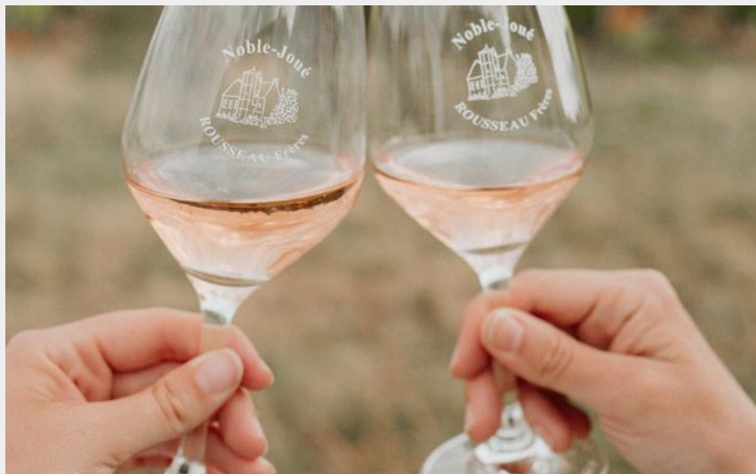
Crédit photo : Maison Rousseau - Rousseau frères, cave à Esvres-sur-Indre. (Ulrike)