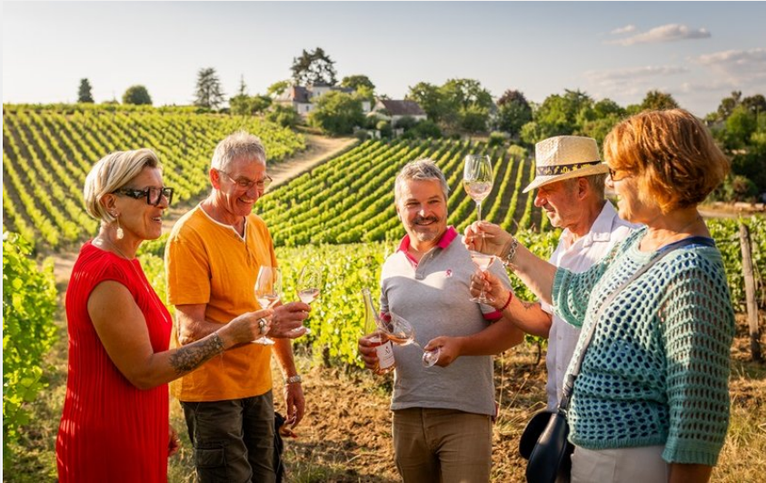
Crédit : Domaine de la Noblaie - Ligré (ADT Touraine - Jean-Christophe COUTAND)