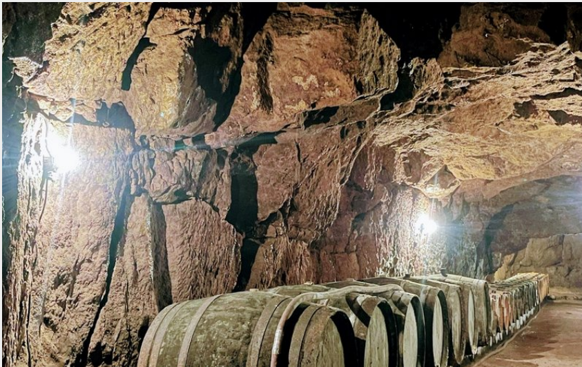
Crédit : CRAVANT-LES-COTEAUX-DOMAINE DE NEUIL (1) (Laurent GILLOIRE)