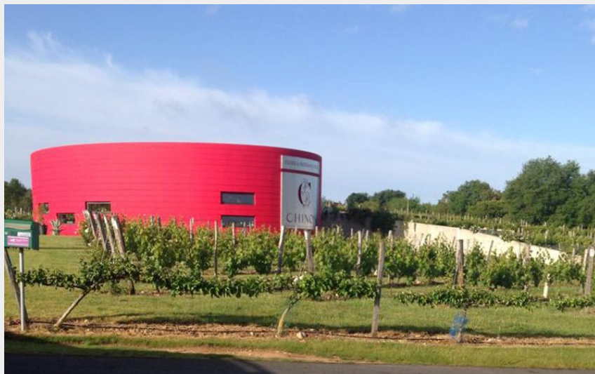
Crédit photo : Chai Pierre et Bertrand Couly - Chinon (P et B Couly)