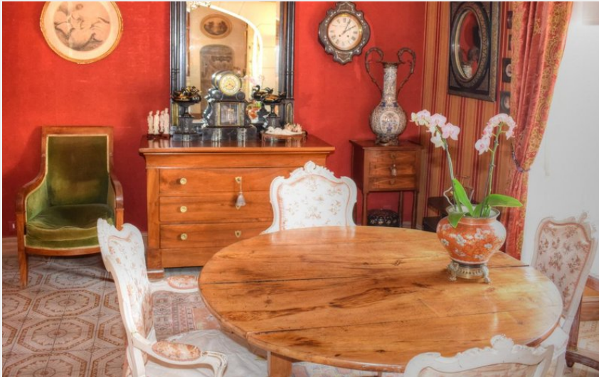
Crédit photo : Closerie de La Véronique_2 (© Relais des gîtes de Touraine)