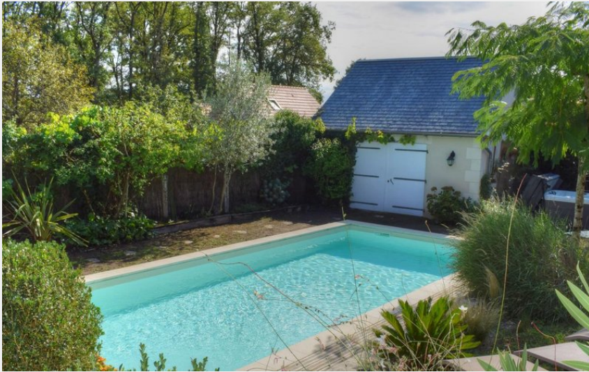
Crédit photo : Le Logis du Lièvre d'Or_3 (© Relais des gîtes de Touraine)