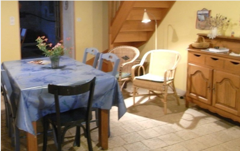
Crédit photo : Le Gîte de Monteneau_3 (© Relais des gîtes de Touraine)